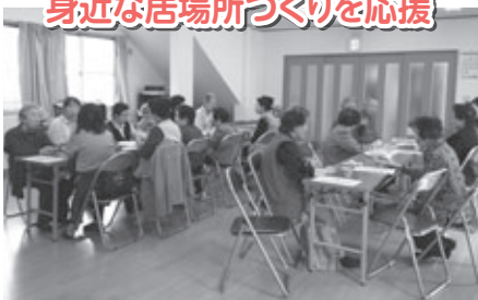
岡地区のサロン「向山お楽しみ会」