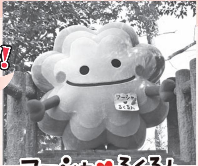
アーシャ♡るくるん